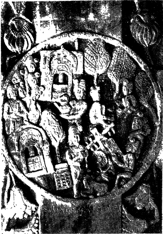
भरहुत—जैतवन विहार दान